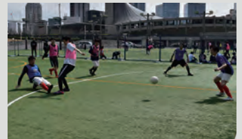
ゴールヘアアシスト