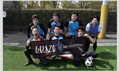
最終結果は 3 位！次こそ優勝を目指します！

純粋にボールを蹴りたい方、運動不足を解消したい方などフットサル未経験でも参加可能です！是非一緒に汗を流しましょう！