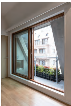
開放感のある木製サッシ