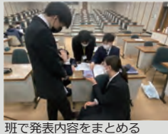
班で発表内容をまとめる

で実際の建築現場の見学をおこないながら、ZEN グループ社員としての行い・心得を学ぶ「1 日 10 軒大八車」などの研修がおこなわれました。