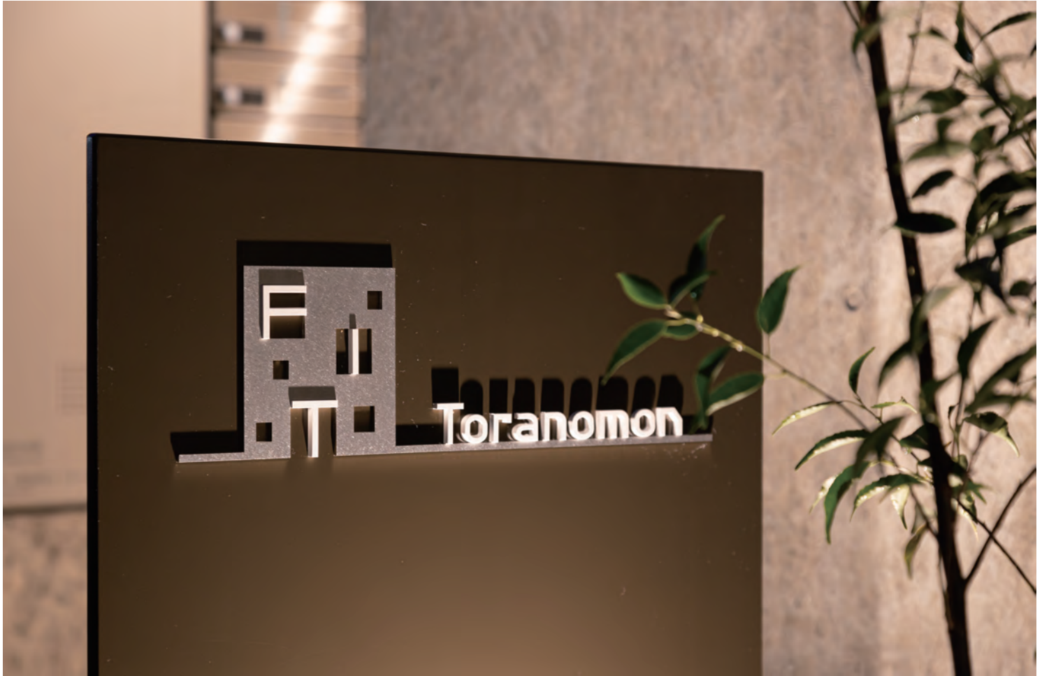
「FIT Toranomom」