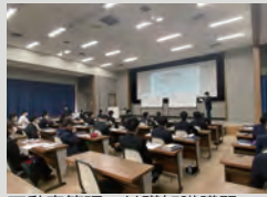
不動産管理の基礎知識講習

今年は、3 月 24 日までは伊豆山研修センターで作務（さむ）を含む建築・不動産の基礎知識の研修、27 日からは株式会社ユニホー本社