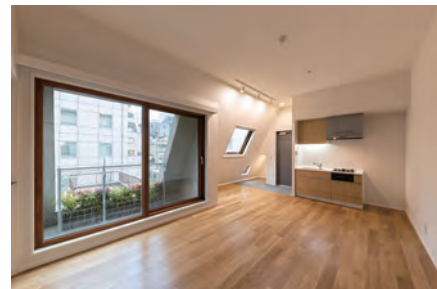
5階貸室。大型の窓と斜め壁の窓で開放感がある