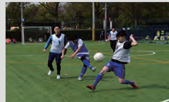
鋭いシュートを放つ鍋島係員