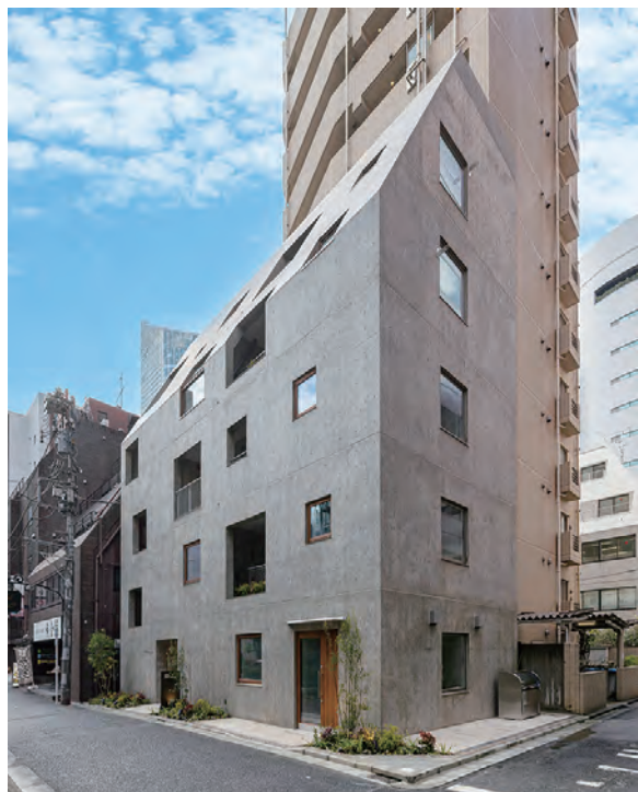
建物全景。特殊コンクリートと木製サッシに柔らかさを感じられる