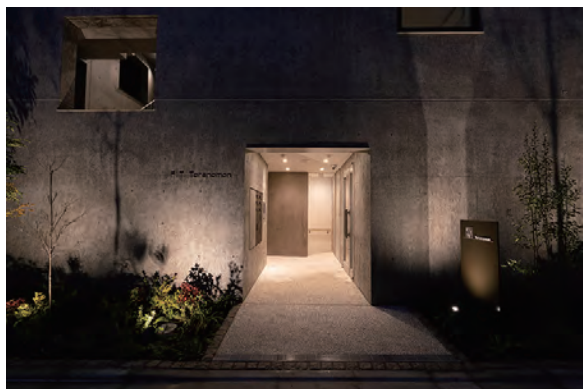
ライトアップによりスタイリッシュさが増すアプローチ夜景