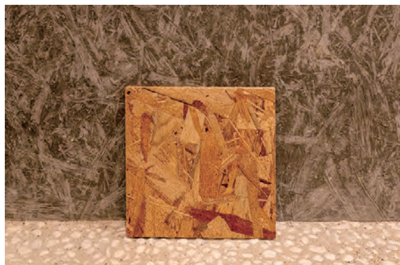
外壁に使用したOSB合板。ディテールをコンクリートで表現。